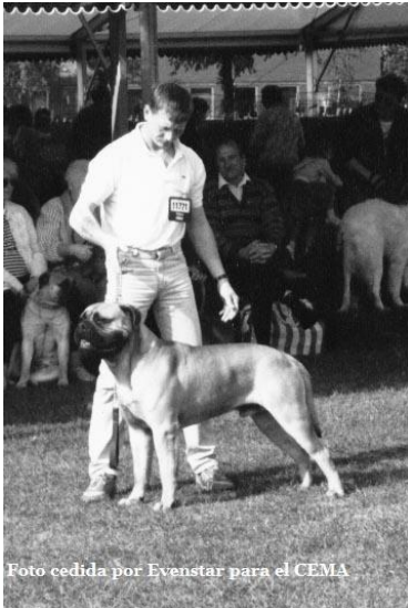
Iron King of Evenstar