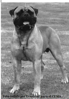
Ch. Iron Bru of Evenstar

Nosotros tenemos 4 campeones de Inglaterra hasta la fecha: Ch. Iron Bru of Evenstar, Ch Last Tango at Evenstar, Ch. Northern Light of Evenstar and Brinscall Huckelberry at Evenstar.