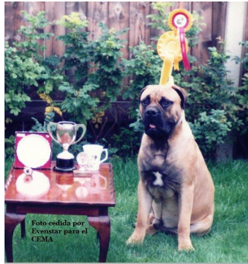
Noble of Oldwell

2) Si tuviera que definir en una palabra al Bullmastiff cual sería?