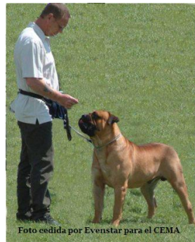
Brinscall Huckelberry at Evenstar.

7) De todos los perros que ha criado y de su propiedad cual es su favorito y porque?