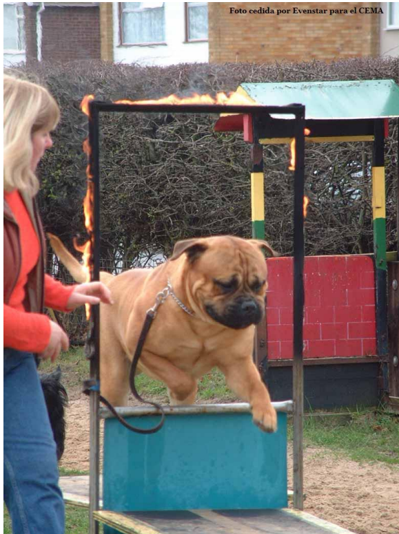
Ranger primera vez que pasa por el “fuego”

11) Cuando escoge un cachorro para exposición usted que busca? Y porque?