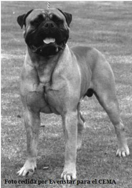
Ch. Iron Bru of Evenstar

6) Cuantos Campeones tiene de su afijo por todo el mundo?