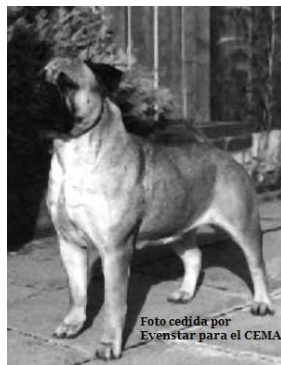
Ch Last Tango at Evenstar